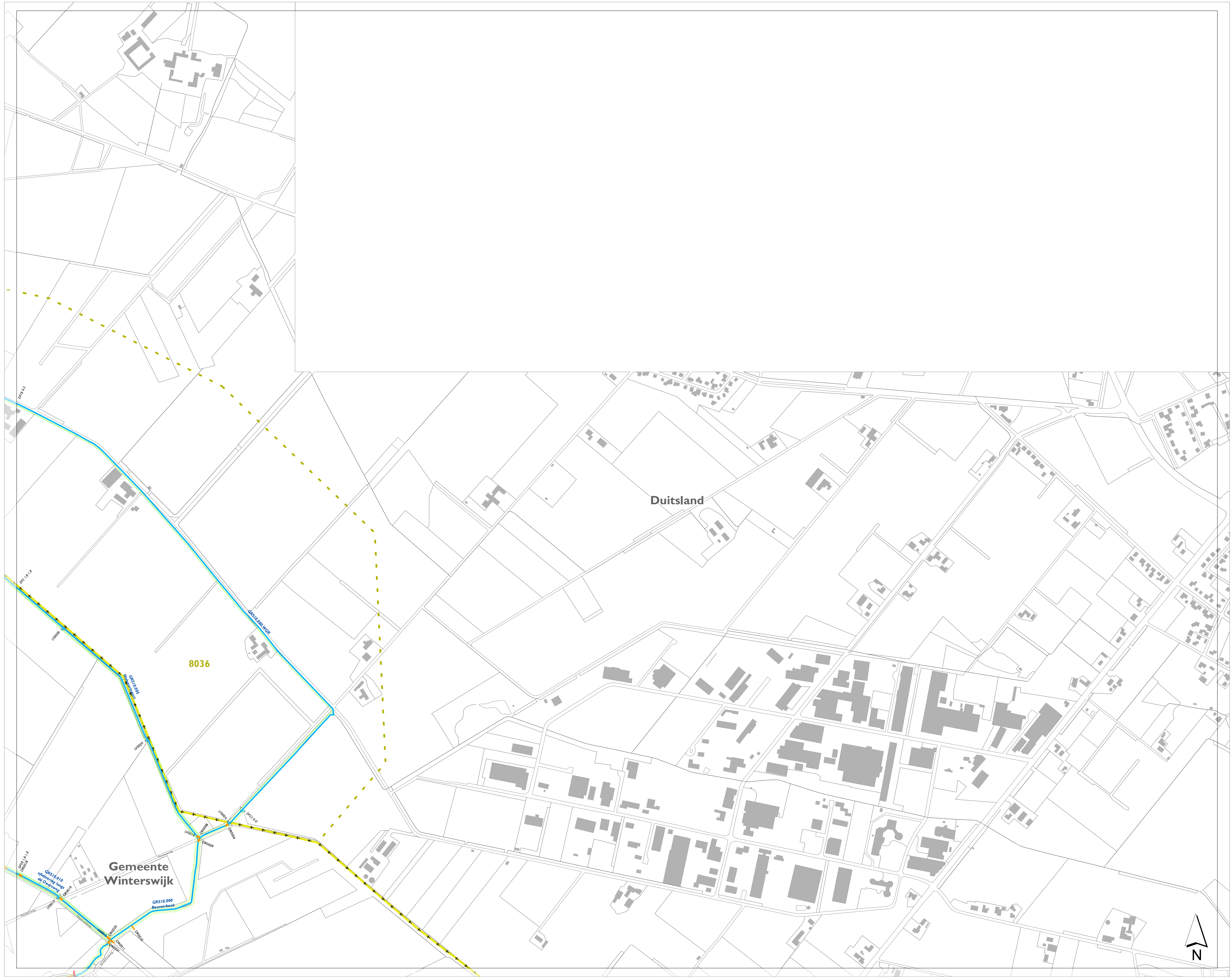
stroomgebieden op de leggerkaart