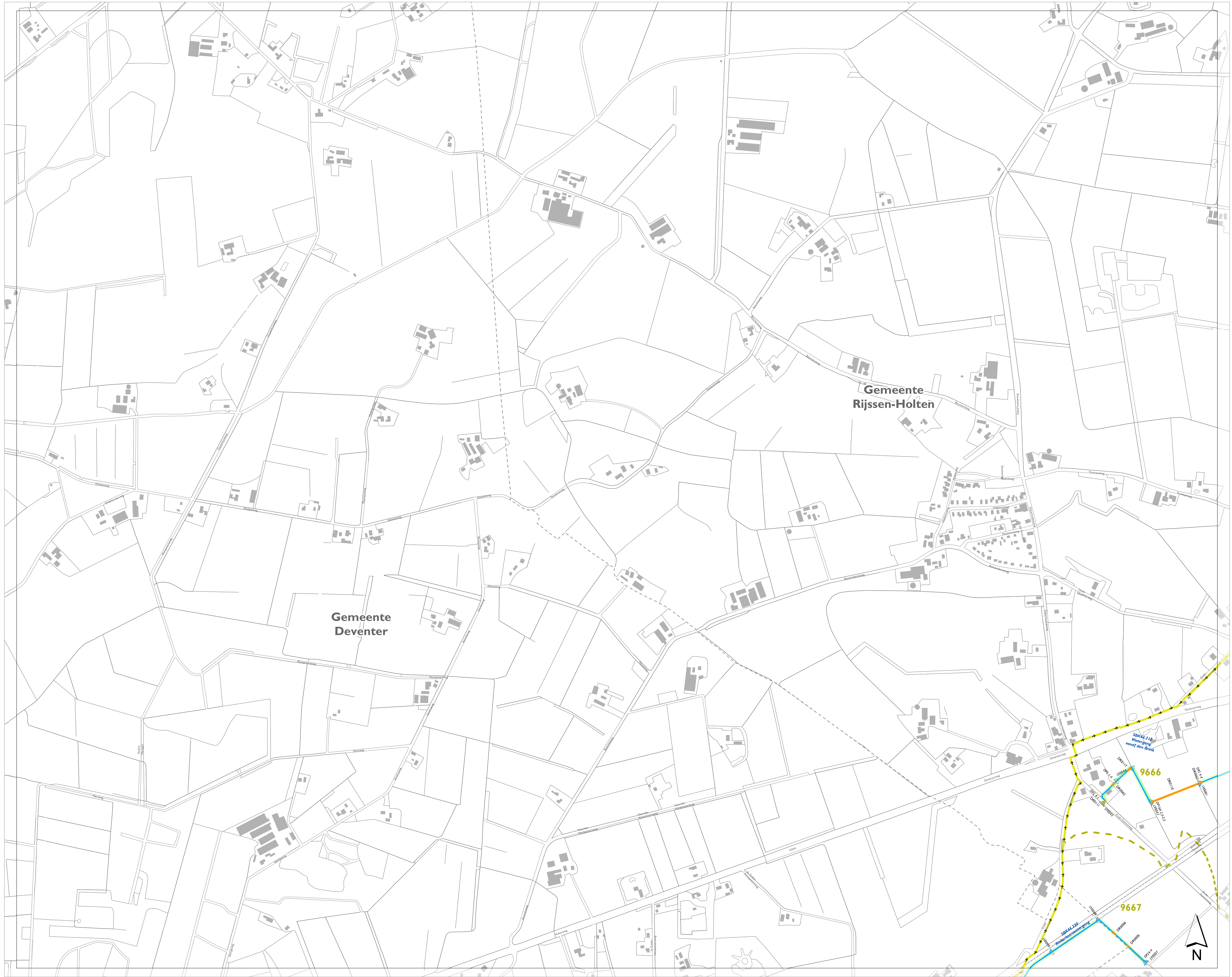
stroomgebieden op de leggerkaart