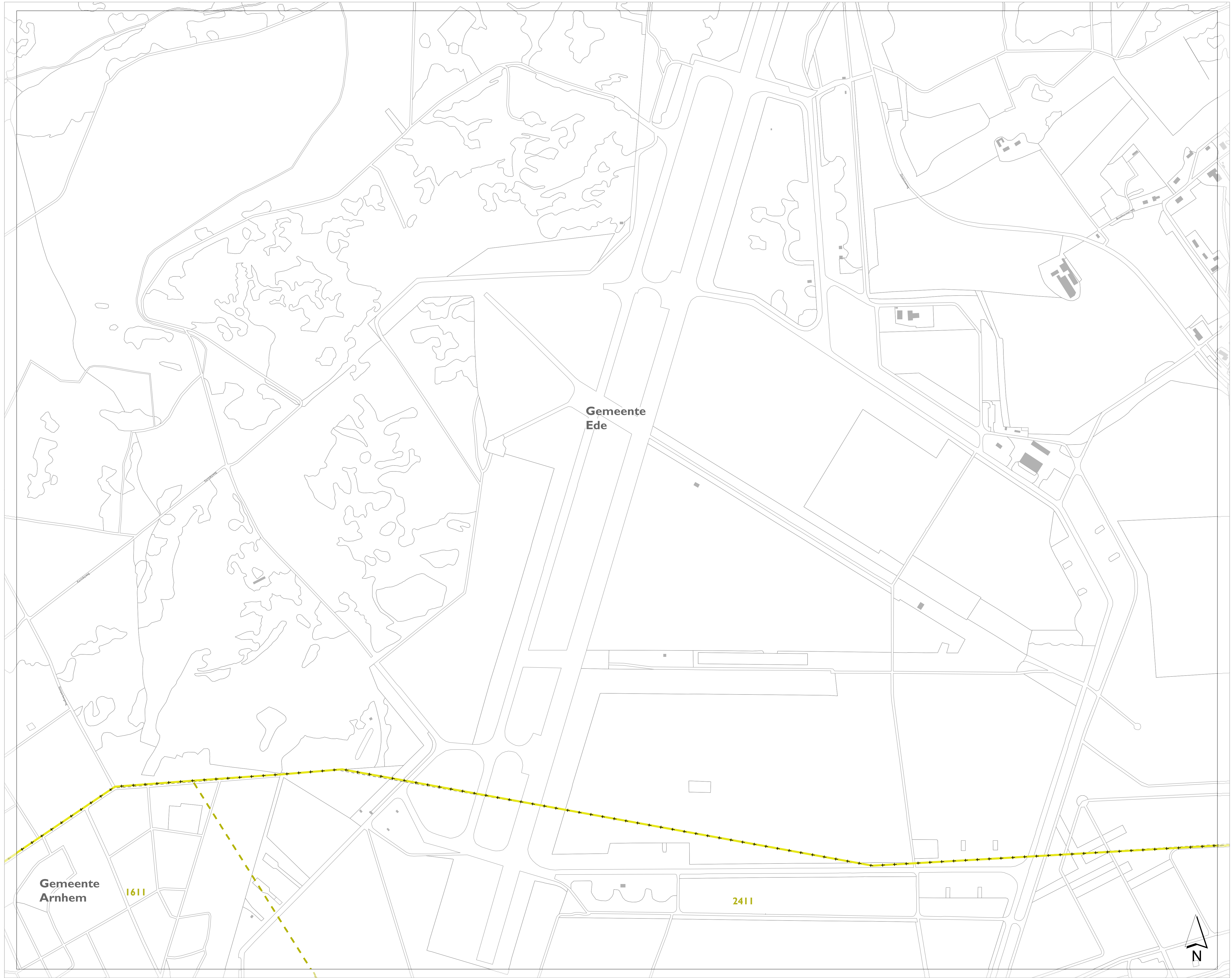
stroomgebieden op de leggerkaart