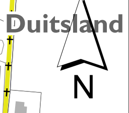
stroomgebieden op de leggerkaart