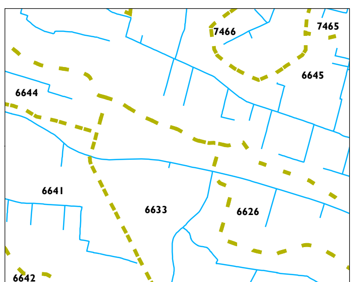
stroomgebieden op de leggerkaart