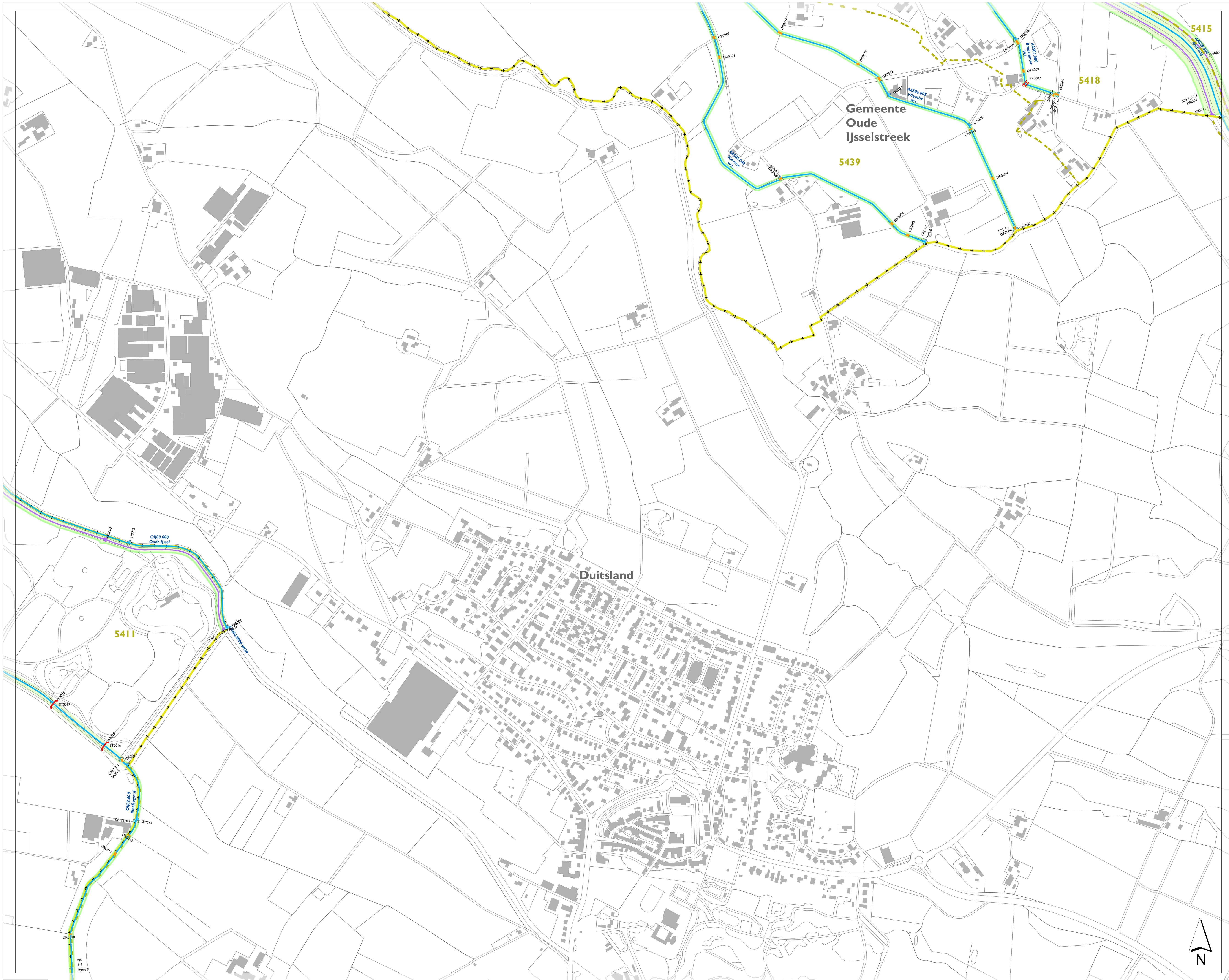
stroomgebieden op de leggerkaart