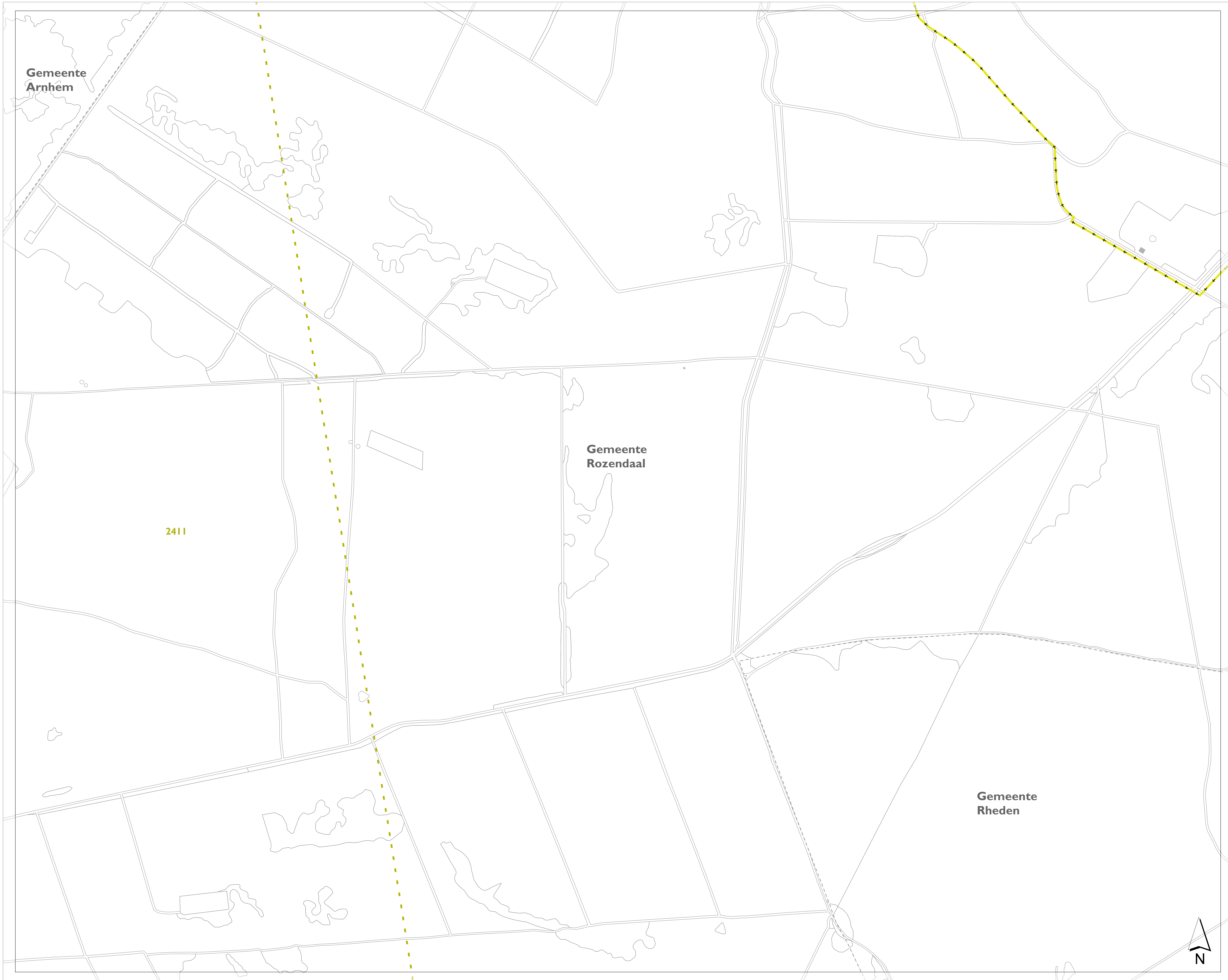
stroomgebieden op de leggerkaart