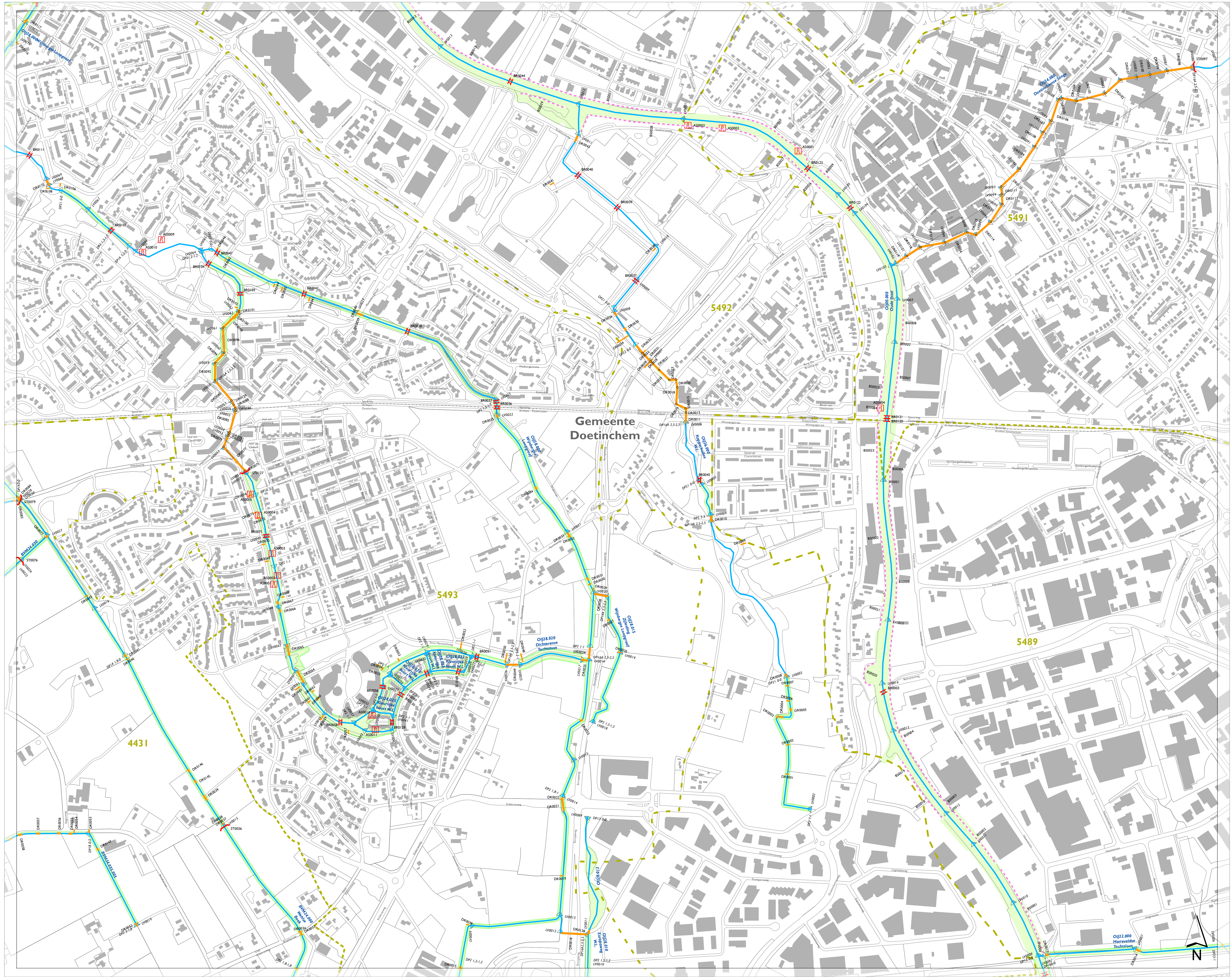
stroomgebieden op de leggerkaart