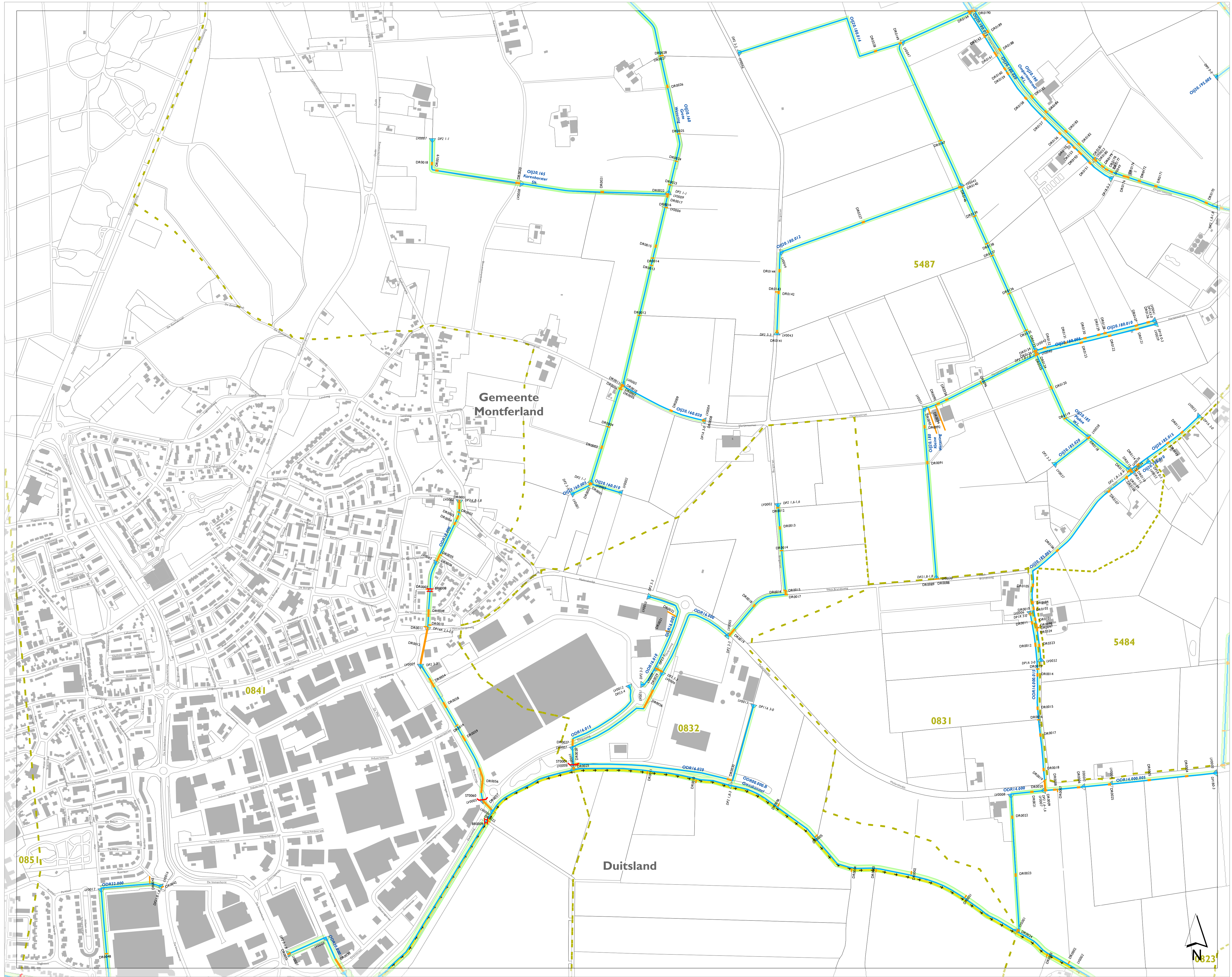
stroomgebieden op de leggerkaart