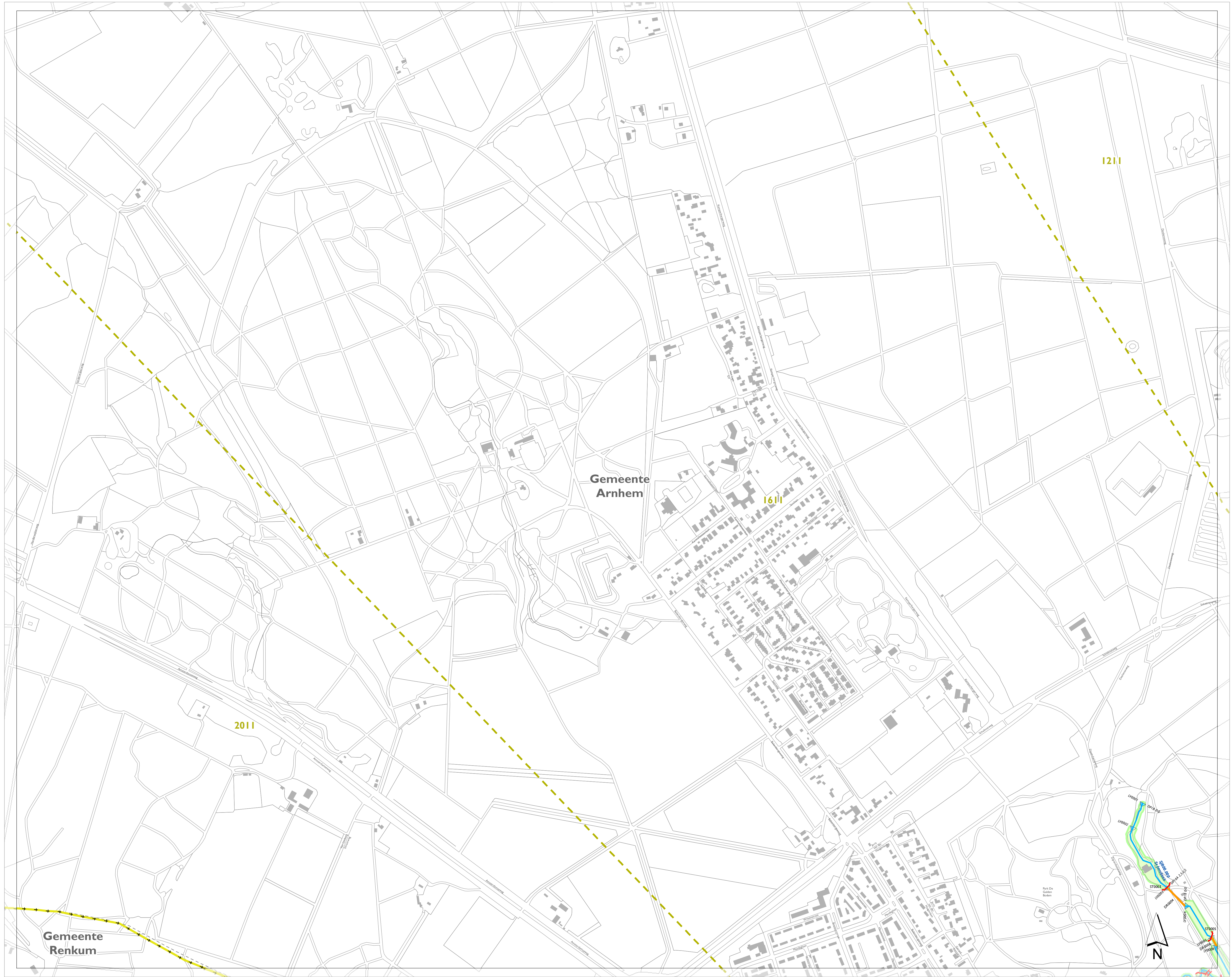
stroomgebieden op de leggerkaart