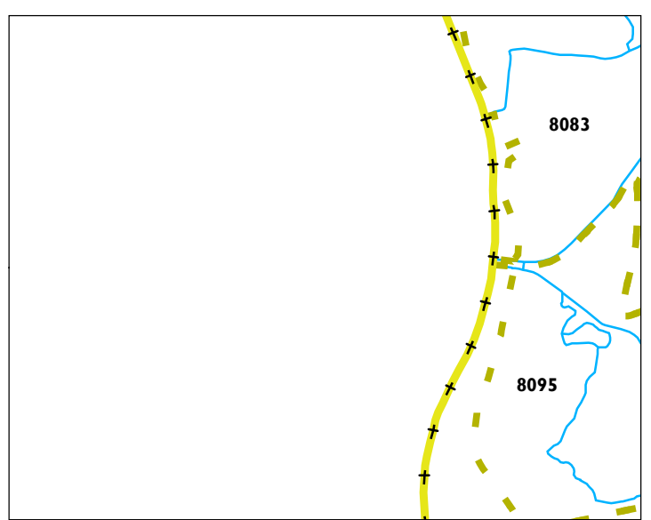
stroomgebieden op de leggerkaart